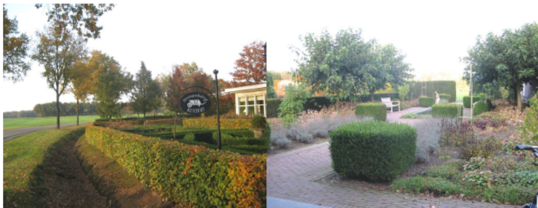
Figuur 12. Huidige beplanting op de locatie Slievenstraat 52

De initiatiefnemer gaat het perceel landschappelijk inpassen met erfbeplanting. De initiatiefnemer zal op het perceel erfbeplanting met hoogstambomen realiseren. Hiertoe worden op de locatie 3 stuks Liquidambar Stryaciflua en 5 stuks Castanea Sativa ingeplant. Deze erfbeplanting is ook op de situatieschets in figuur 10 weergegeven. Daar de erfbeplanting ook het visitekaartje voor het hoveniersbedrijf is, staat de initiatiefnemer ervoor in het erf verzorgd te houden, zoals hij ook de rest van het perceel verzorgd. Onderstaand figuur geeft een impressie van de mate van zorg die de initiatiefnemer besteed aan het onderhouden van zijn perceel.